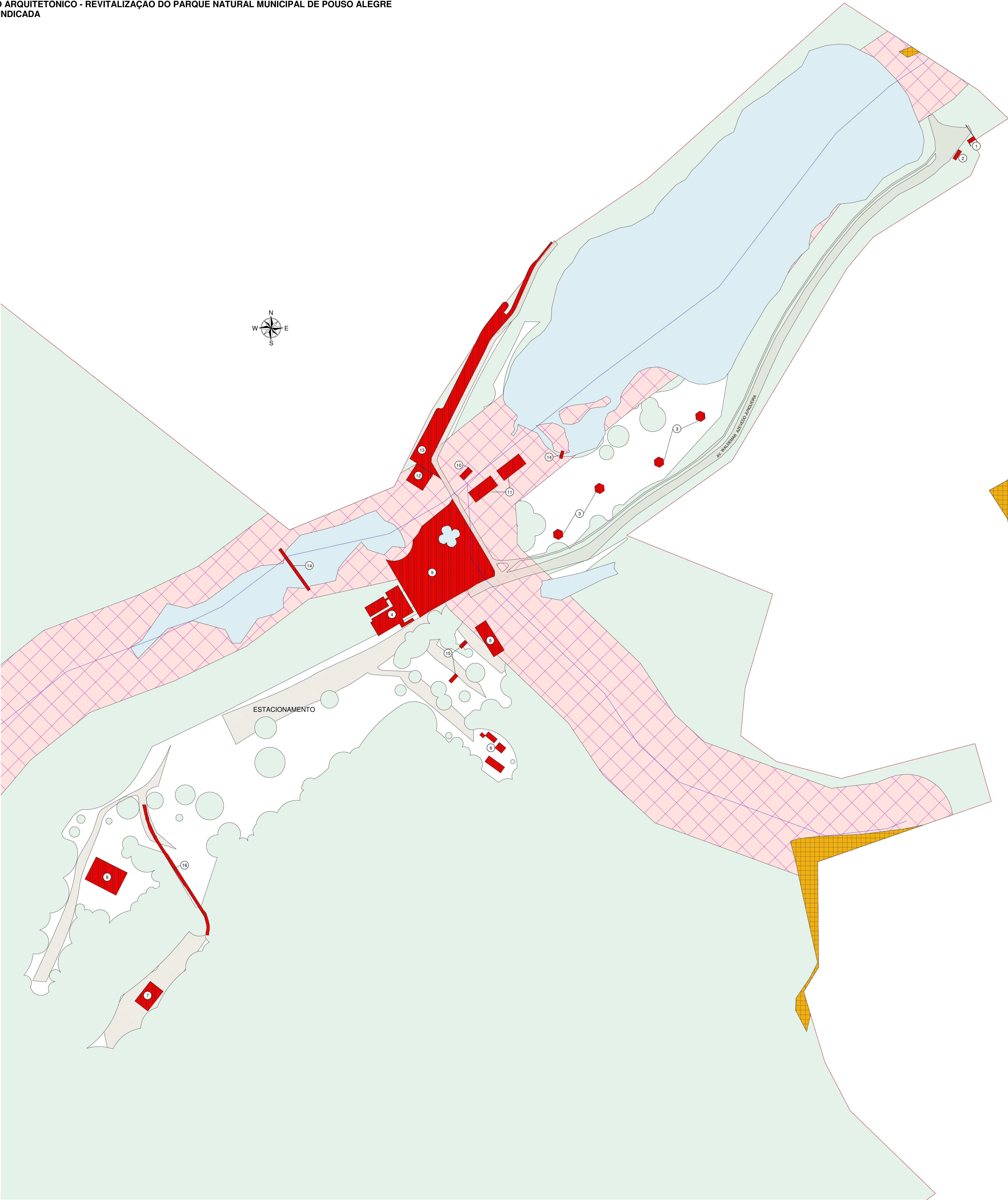
1 LOCAÇÃO DOS PROJETOS 1 : 1000