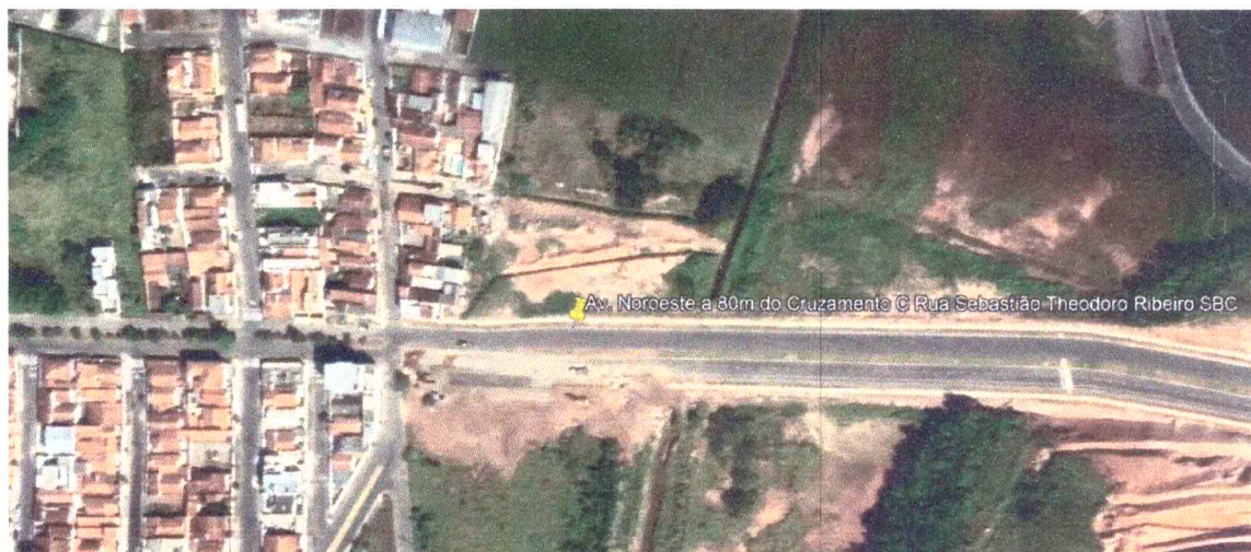
Vista Superior – Fonte: Google Earth